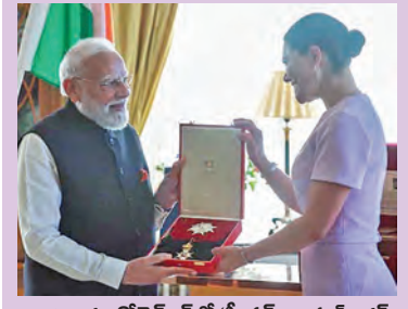
ఆదివారం గోధున్ బర్లో 'స్వీడన్ రాయల్ ఆర్డర్ ఆఫ్ పోలార్ స్టార్'ను అందుకుంటున్న ప్రధాని

ప్రధాని మోడీకి స్వీడన్ అత్యున్నత పురస్కారం 'స్వీడన్ రాయల్ ఆర్డర్ ఆఫ్ పోలార్ స్టార్' బహుకరణ మోడీకి 31వ అంతర్జాతీయ గౌరవం గోధున్ బర్, మే 17: భారత ప్రధాని నరేంద్ర మోడీకి స్వీడన్ దేశపు అత్యున్నత పురస్కారం లభించింది. అత్యంత ప్రాధాన్యత ఈ అవార్డు అందుకున్న అరుదైన విదేశీ ప్రముఖుల్లో ప్రధాని మోడీ నిలిచారు. 'స్వీడన్ రాయల్ ఆర్డర్ ఆఫ్ పోలార్ స్టార్'ను ఆదివారం రాజధాని గోధున్ బర్లో జరిగిన ప్రత్యేక కార్యక్రమంలో ఆయనకు అందజేశారు. >>2