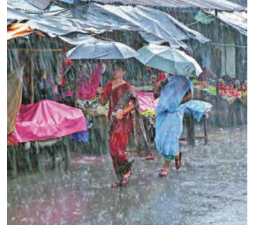
అందమాన్ లోకి ప్రవేశించిన రుతుపవనాలు

ప్రధాని మోడీకి స్వీడన్ అత్యున్నత పురస్కారం 'స్వీడన్ రాయల్ ఆర్డర్ ఆఫ్ పోలార్ స్టార్' బహుకరణ మోడీకి 31వ అంతర్జాతీయ గౌరవం గోధున్ బర్, మే 17: భారత ప్రధాని నరేంద్ర మోడీకి స్వీడన్ దేశపు అత్యున్నత పురస్కారం లభించింది. అత్యంత ప్రాధాన్యత ఈ అవార్డు అందుకున్న అరుదైన విదేశీ ప్రముఖుల్లో ప్రధాని మోడీ నిలిచారు. 'స్వీడన్ రాయల్ ఆర్డర్ ఆఫ్ పోలార్ స్టార్'ను ఆదివారం రాజధాని గోధున్ బర్లో జరిగిన ప్రత్యేక కార్యక్రమంలో ఆయనకు అందజేశారు. >>2